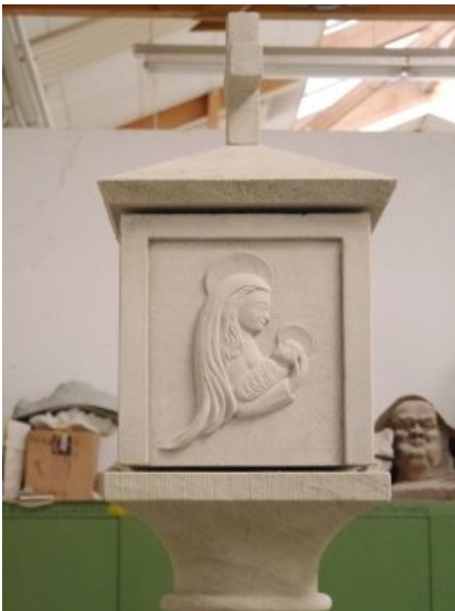
Die fertige Madonna am Bildstock.