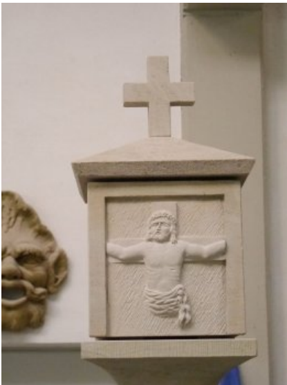
Detail am fertigen Bildstock.