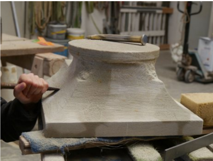
Anfertigen des Kapitells, das einen Übergang des runden Querschnitts der Säule zum quadratischen Querschnitt des Aufsatzes bildet.