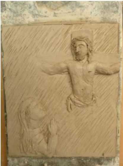
Vorlage des Kreuzigungsbildnisses. Tatsächlich wurde nur der Ausschnitt des Jesus am Kreuz angefertigt.