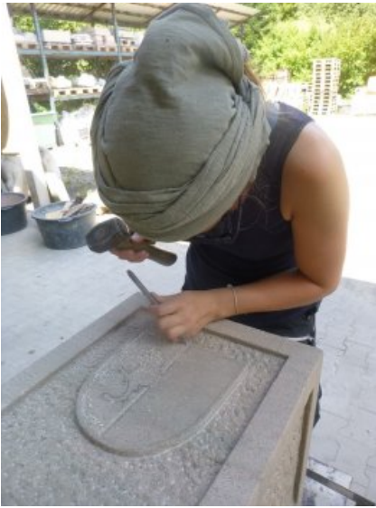
Beim Arbeiten des profilierten Sockels mit eingelassenen Spiegelflächen.