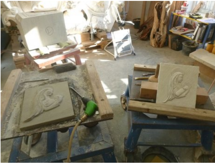
Fertigung der Madonna mit Kind.