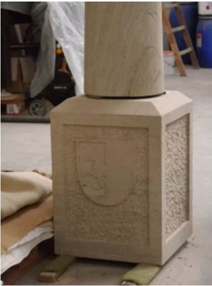
Der fertige Sockel.