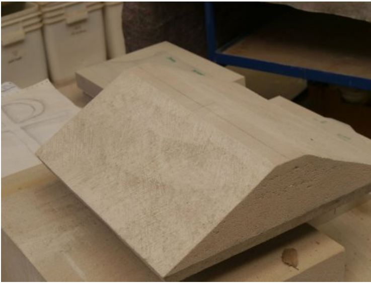
Die Verdachung vor Abschluss der Arbeiten.