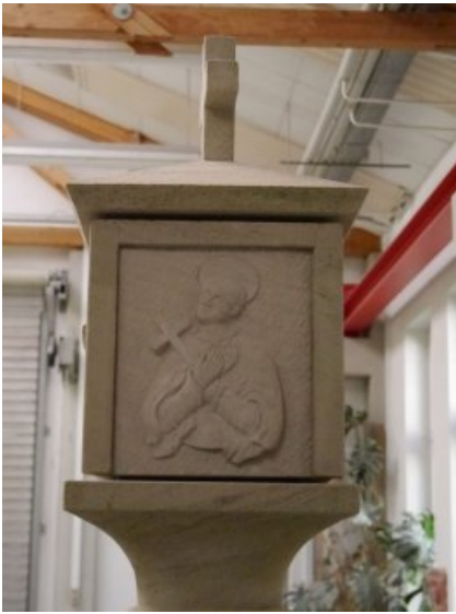
Detail des Heiligen Franz Xaver.