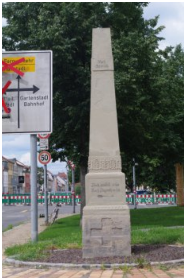
Der Obelisk nach der Restaurierung.