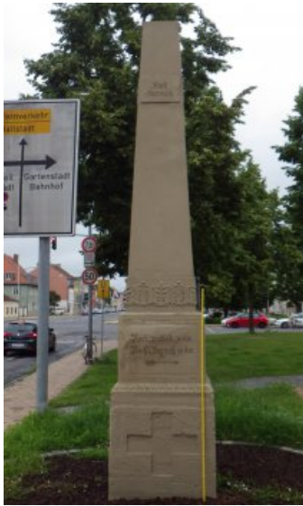
Der Wegweiser in Obelikform vor der Konservierung und Restaurierung.