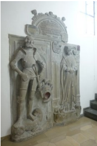
Endzustand Epitaph Südwest