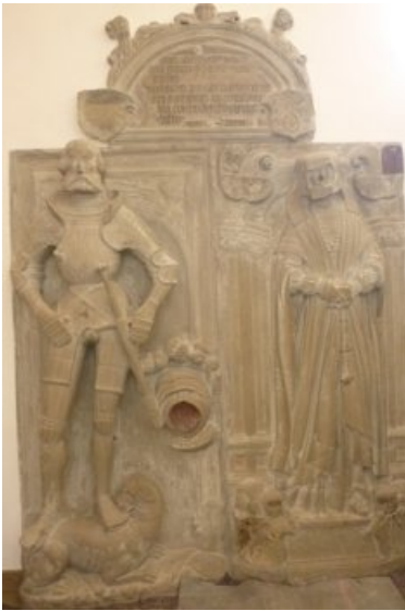
Vorzustand Epitaph Südwest