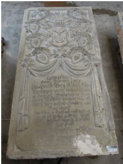
Vorzustand Epitaph Südost