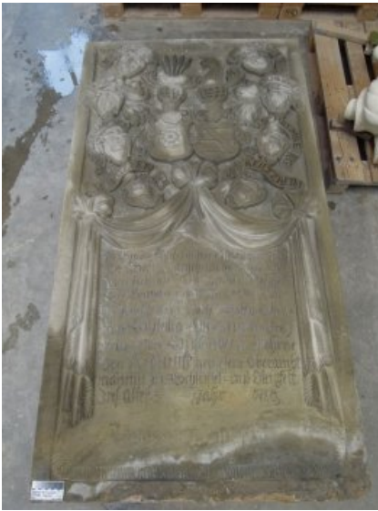
Vorzustand Epitaph Nordost