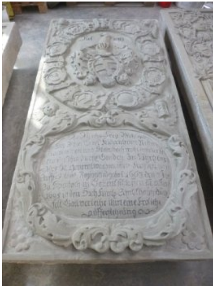
Endzustand Epitaph Nordwest