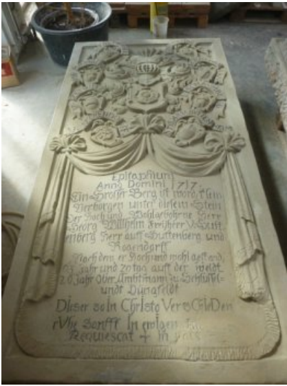
Endzustand Epitaph Südwest