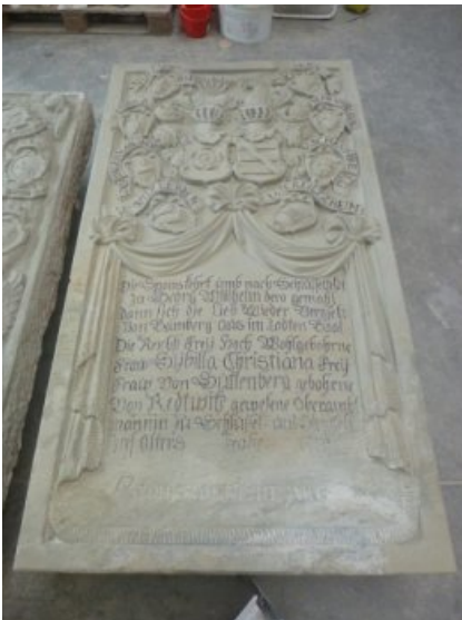
Endzustand Epitaph Nordost