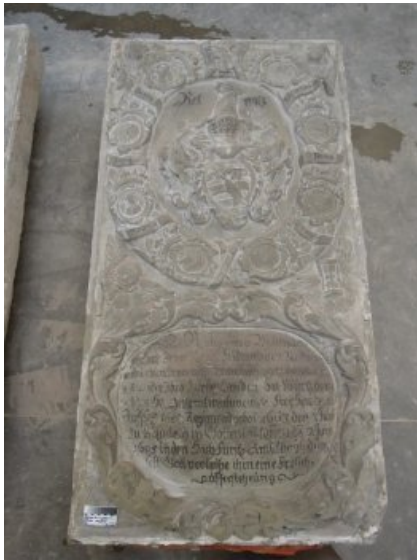
Vorzustand Epitaph Nordwest