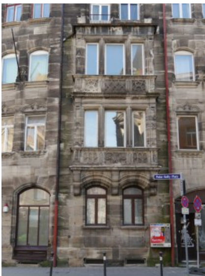
Der Flacherker des Mietshauses in der Gostenhofer Hauptstraße 73 vor der Restaurierung. Die obere steinerne Balkonbrüstung fehlt.