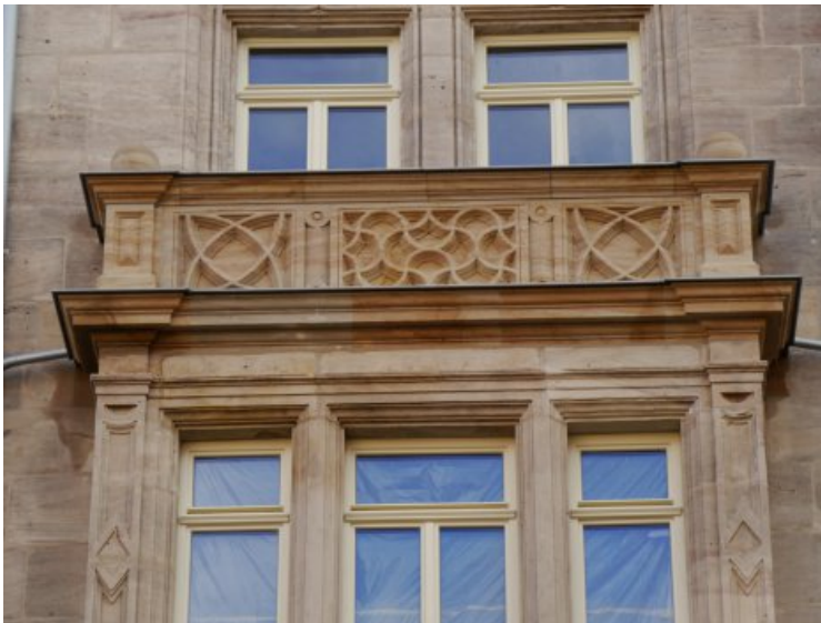
Die ergänzte Flacherkerbrüstung nach Abschluss der Maßnahme.