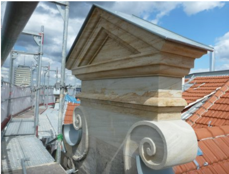
Die mittlere Giebelbekrönung nach der Restaurierung. Als Vorlage diente der Plan von 1897.