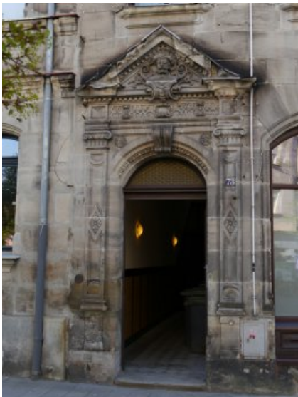
Das Eingangsportal vor der Restaurierung.