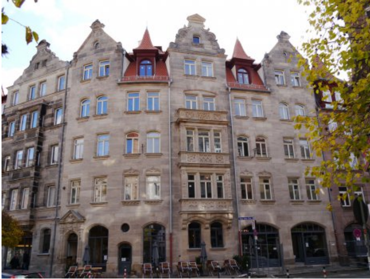
Die Fassade des Mietshauses in der Gostenhofer Hauptstraße 73 nach der Restaurierung.