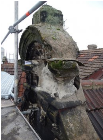
Die südwestliche Giebelbekrönung war vor der Restaurierung stark reduziert, entfestigt und intensiv durch Mikroorganismen bewachsen.