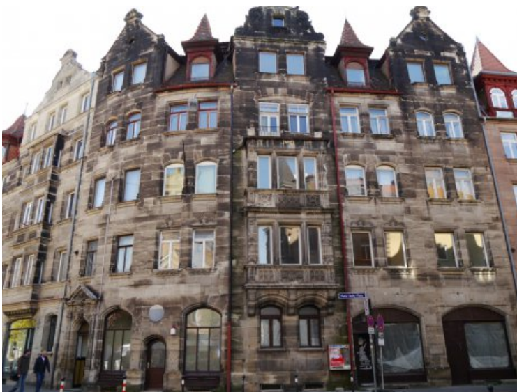
Die Fassade des Mietshauses in der Gostenhofer Hauptstraße 73 vor der Restaurierung.