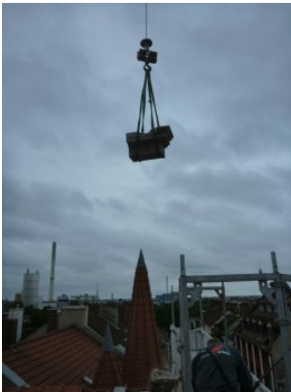
Beim Heben der Neuteile mit dem Autokran.