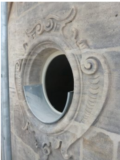
Das Giebelfenster mit Rollwerk nach Reinigung im Partikelstrahlverfahren, Ergänzung von Fehlstellen und Neuverfugung.