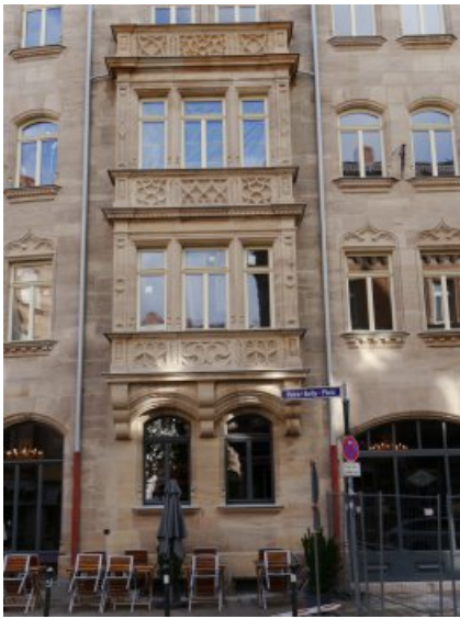
Der Flacherker des Mietshauses in der Gostenhofer Hauptstraße 73 nach der Restaurierung. Die obere Balkonbrüstung wurde ergänzt.