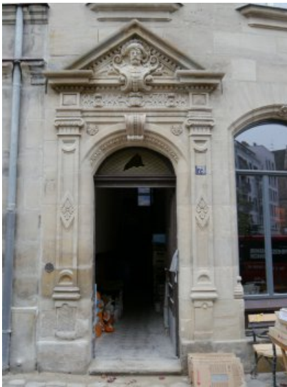
Das Eingangsportal mit Portalgiebel nach der Restaurierung.