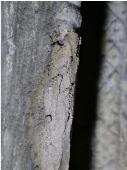
Detailfoto einer schadhaften und farblich unpassenden Altergänzung, welche es zu ertüchtigen galt.