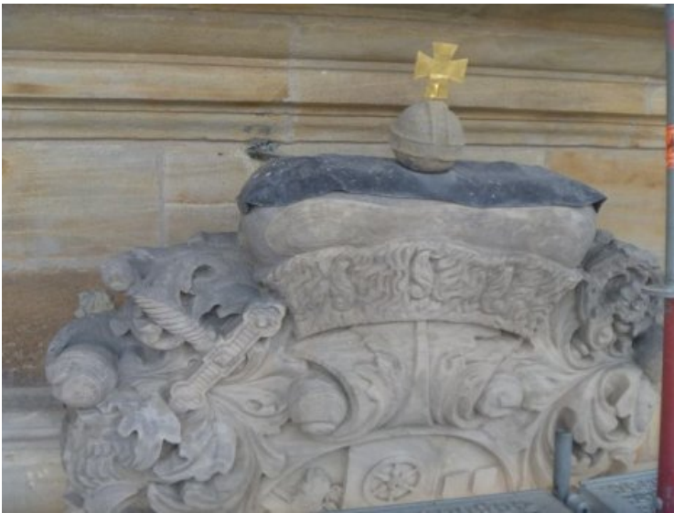
Ausschnitt des Doppelwappens im Endzustand nach erfolgter Restaurierung.