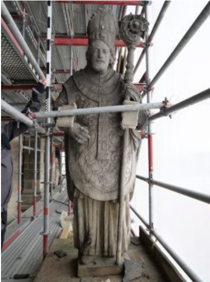
Aufnahme der Skulptur des Hl. Ottos während der temporären Lagerung auf dem Gerüst.