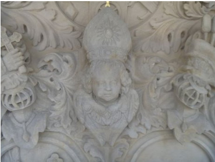
Detailfoto des Doppelwappens nach Fertigstellung der Maßnahmen.