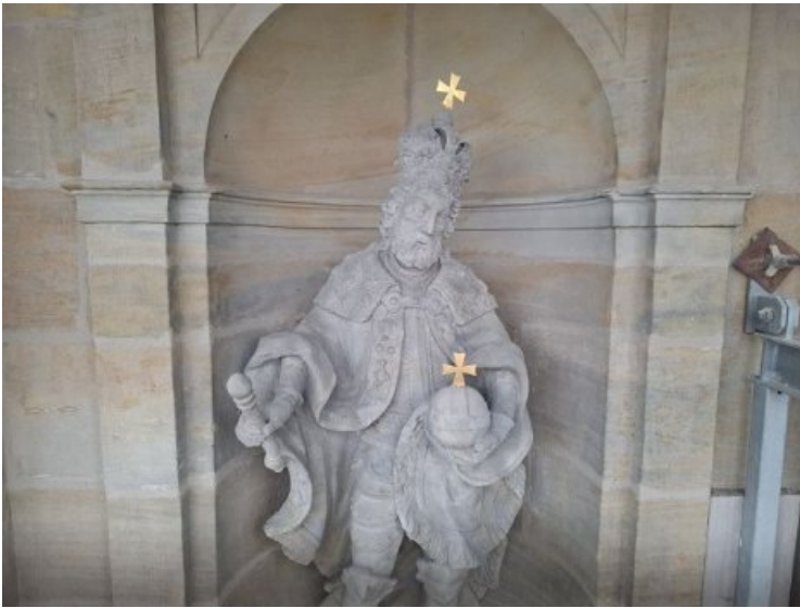
Die steinerne Figur des Kaiser Heinrich nach dem Beenden sämtlicher Maßnahmen.