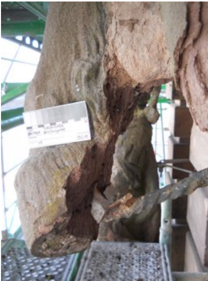
Der Vorderlauf des Pferdes Christians vor der Restaurierung.