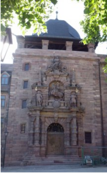
Das Christiansportal nach der Restaurierung.