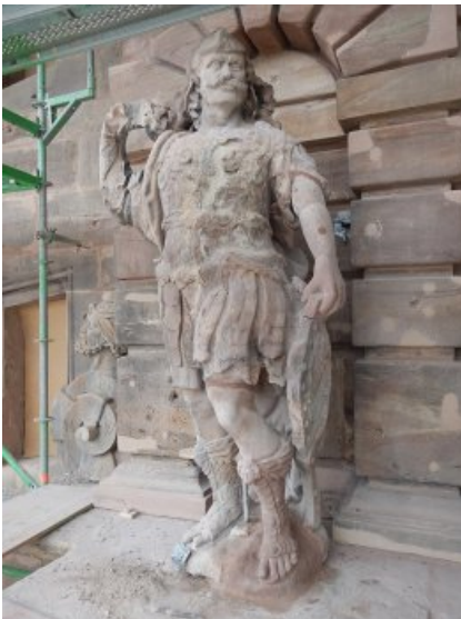
Nach Einbau der bildhauerischen Vierung.