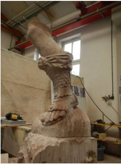
Während der Herstellung der bildhauerischen Vierung in der Werkstatt.