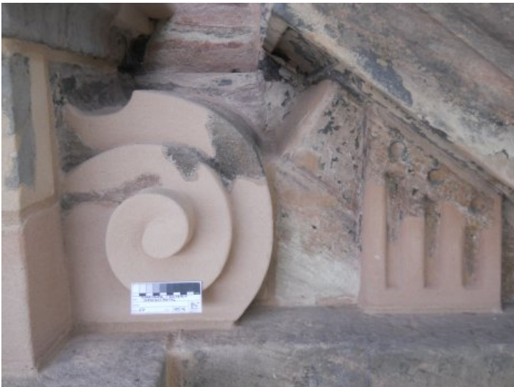
Die Volute, die vor der Restaurierung Altergänzungen, Fehlstellen, Risse und entfestigte Bereiche aufwies, wurde mit Steinersatzmasse ergänzt.