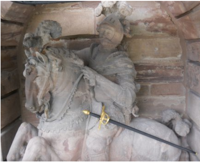
Die Christiansskulptur nach der Restaurierung.