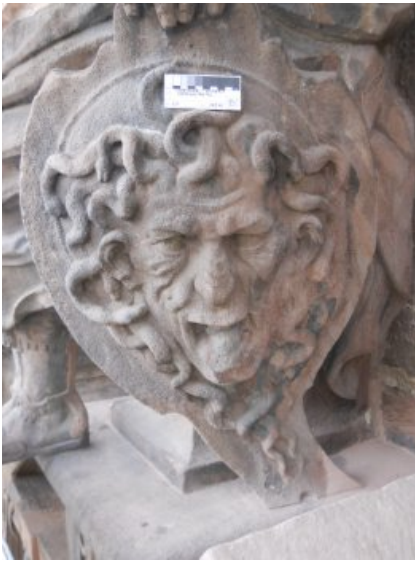
Der Schild der Minerva nach der Restaurierung.