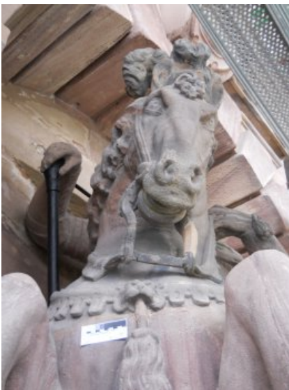
Das Pferd Christians nach der Restaurierung