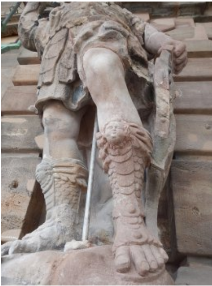
Das Bein des linken Kriegers nach der Restaurierung.