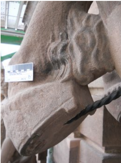
Der Vorderlauf des Pferdes Christians nach Wiedereinbau der tordierten Klammer und Ergänzung der Fehlstellen.