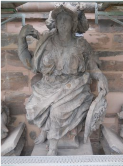
Die Skulptur der Minerva nach der Restaurierung.