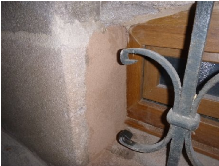
Nach dem Antrag mit Steinersatzmörtel in Anpassung an den umgebenden Naturstein, ohne Retusche.