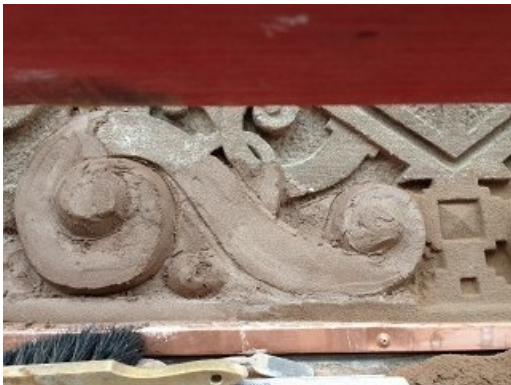
Profiliertes Architekturelement eines Brüstungsfeldes am Erker nach dem Antrag mit Steinersatzmörtel, über Oberflächenniveau.