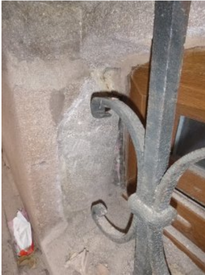
Vor der Entfernung der Altergänzung, Sockel am Kellerfenster.