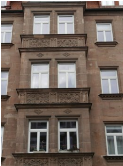
Erker Straßenseite vor der Restaurierung.