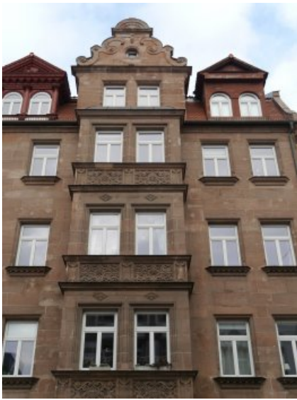
Fassade vor der Reastaurierung.