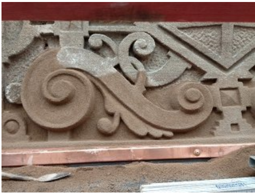
Das Ornament nach der Überarbeitung und Formulierung.