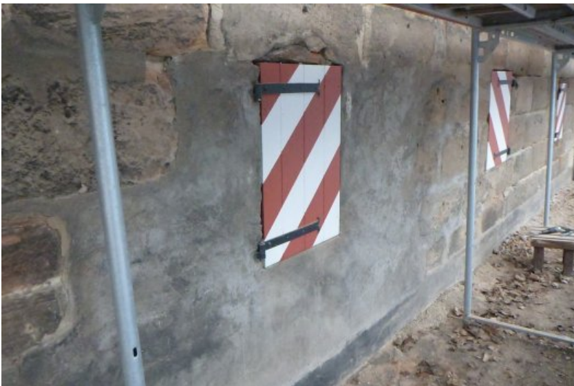
Ansicht eines Mauerabschnittes im Vorzustand