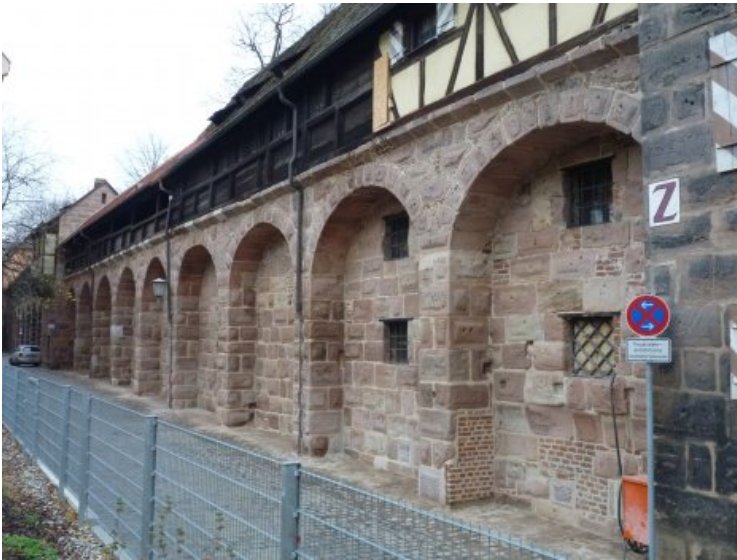
Ansicht der stadtseitigen Wehrmauer