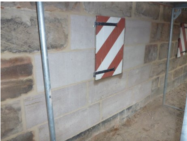
Der Mauerabschnitt nach Fertigstellung der Arbeiten