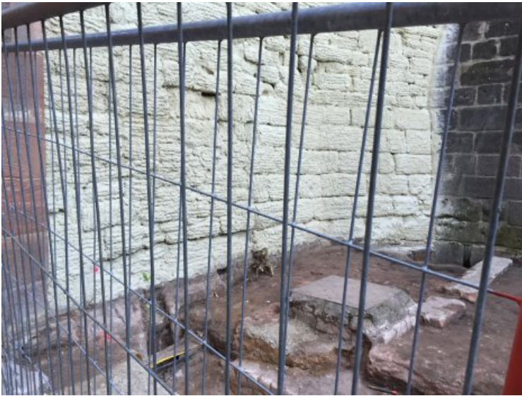
Das Mauerwerk hier mit Salzreduzierungskomresse.