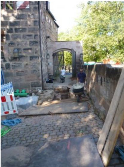
Beim Transport der Salzreduzierungskomresse zum Einsatzort.