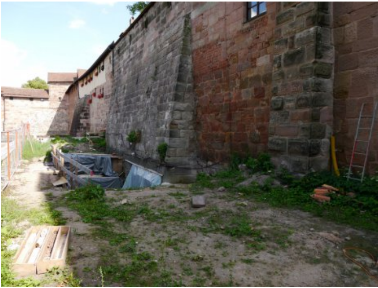
Das Mauerwerk vor der Bearbeitung.