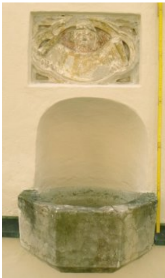
Vorzustand von Relief und Weihwasserbecken, 2013