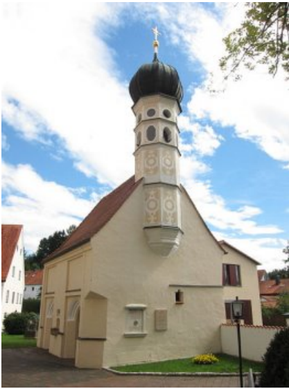
Westansicht der Michaelskapelle südlich der Wallfahrtskirche mit Blick auf die Objekte an der Nordfassade