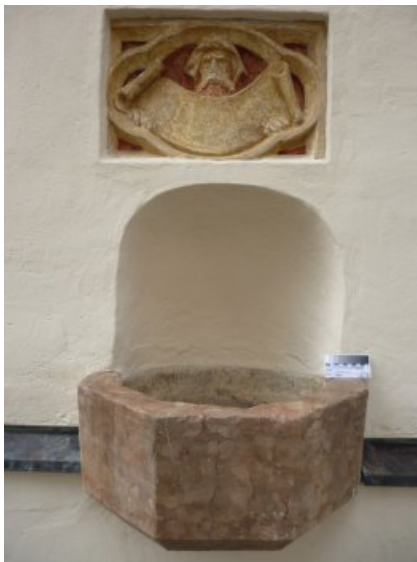
Zustand von Relief und Weihwasserbecken nach Restaurierung und Konservierung, 2014