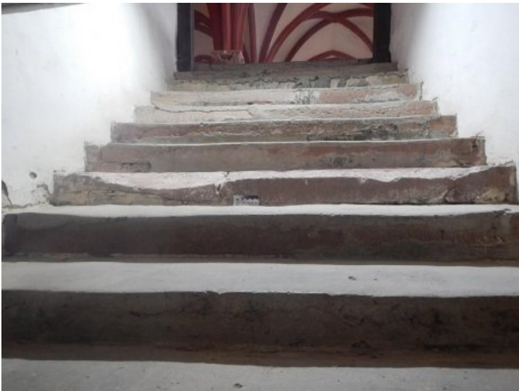
Die Stufen des westlichen Treppenaufgangs zum Dormitorium sind teils stark ausgebrochen und verwittert.