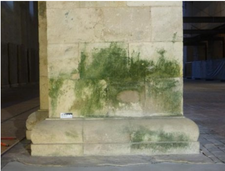
Der Sockel einiger Säulen ist durch biogene Auflagerungen belastet.