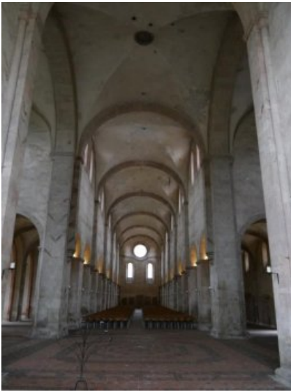
Blick ins Langhaus vor Beginn der Maßnahmen