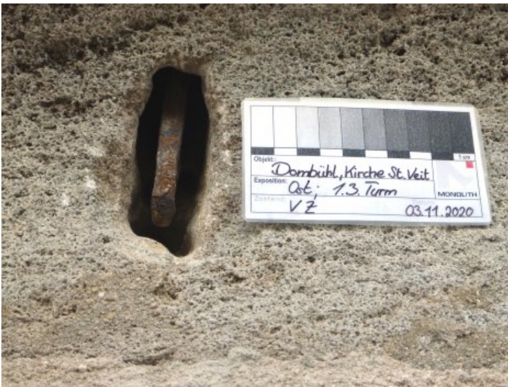
Nach dem Freilegen des Metallhakens.