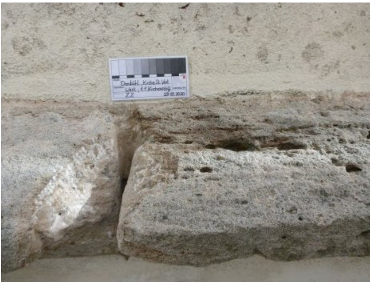
Die defekte Altergänzung wurde entfernt.