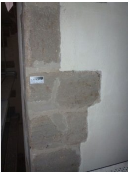
Nachzustand: Beispiel einer Ergänzung im Eckquaderbereich.