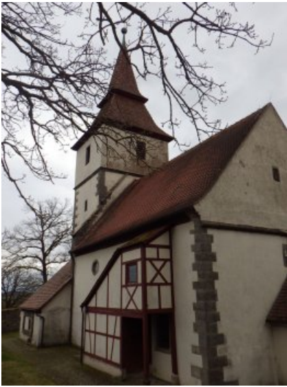
Vorzustand: Die Nordseite der Kirche in der Gesamtansicht.