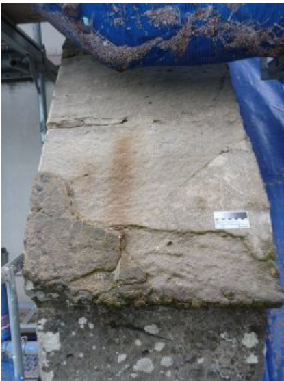
Vorzustand: Fläche mit Altergänzungen und eingelegtem Gewebe.