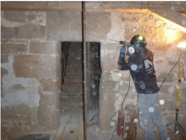
Während dem Setzen der Bohrung für die anschließende Vernadelung.