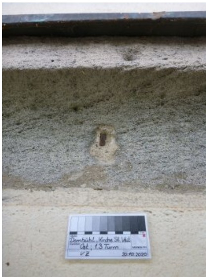
Vorzustand: Funktionsloser Metallhaken im Mauerwerk.