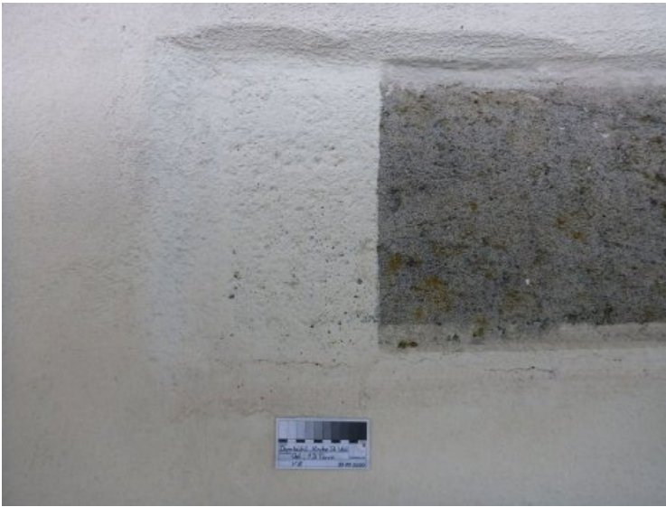
Ostfassade Turm, Vorzustand: Manche Steinoberflächen waren mit Fassadenanstrich gefasst.