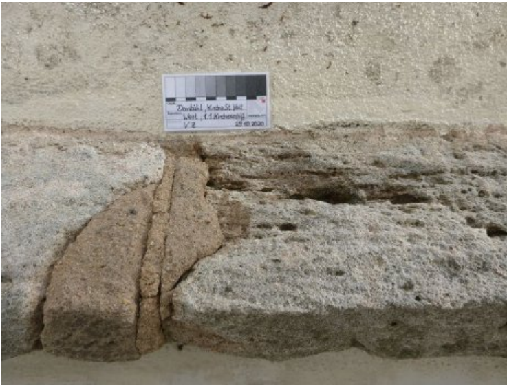
Vorzustand: Defekte Altergänzung an der Westfassade des Kirchenschiffs.