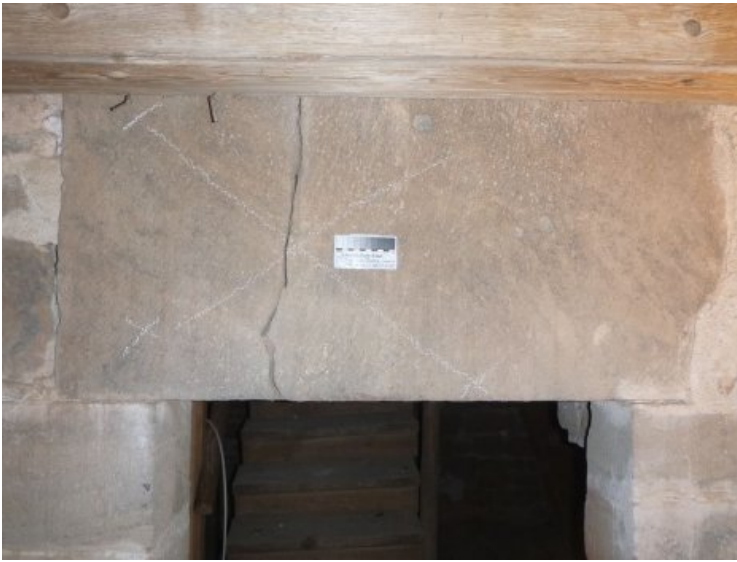
Vorzustand: Riss im Türsturz im Innenbereich des Turms.