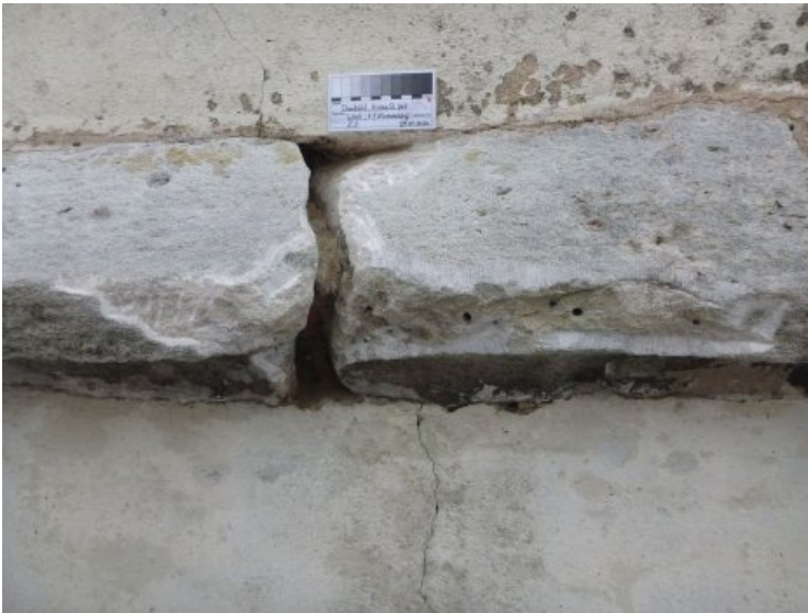
Nach der Entfernung der defekten Altergänzung und des biogenen Bewuchses.