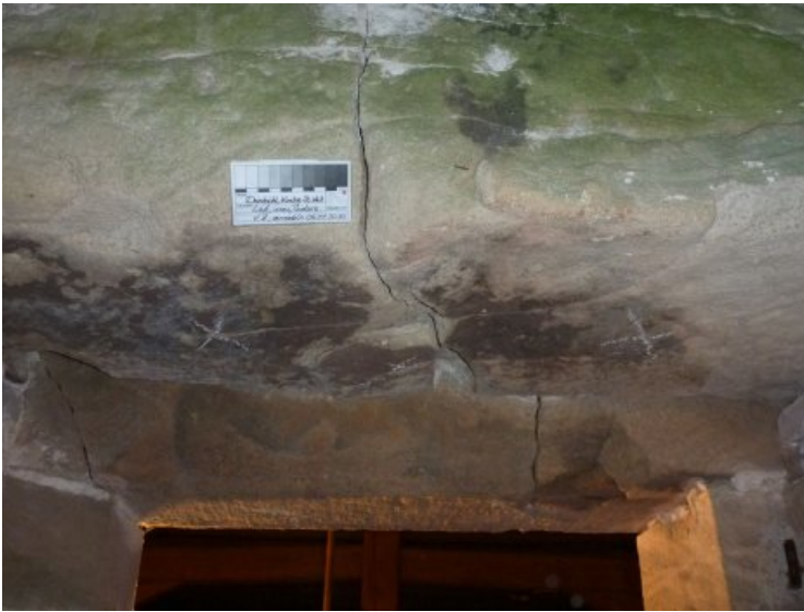
Untersicht des Türsturzes.