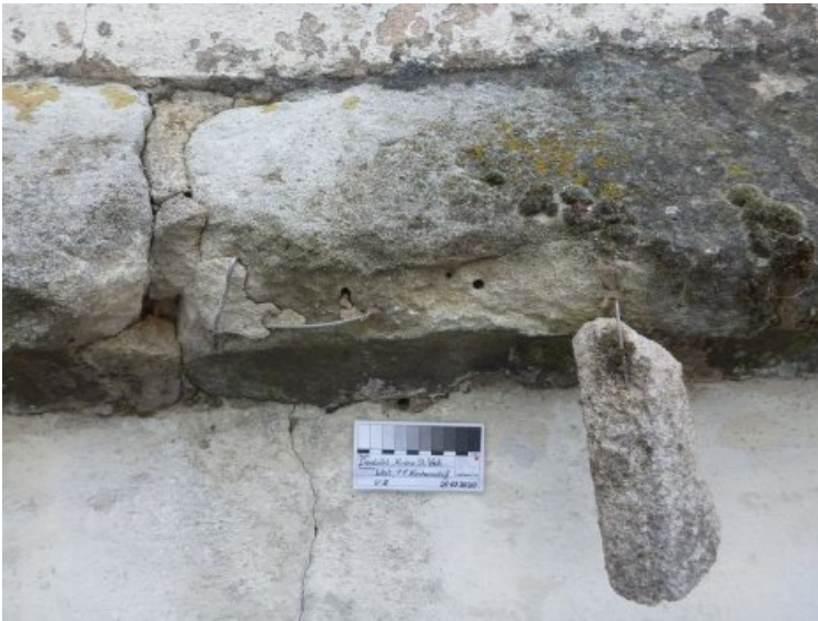
Eine defekte Verankerung aus vorherigen Restaurierungsarbeiten.