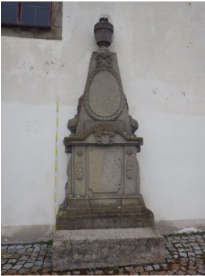
Epitaph an der Südseite des Kirchenschiffs im Vorzustand.