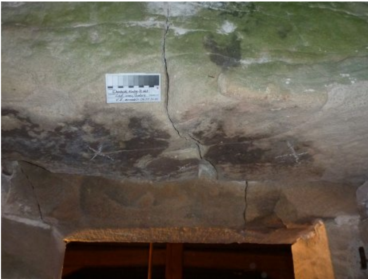
Untersicht des Türsturzes.