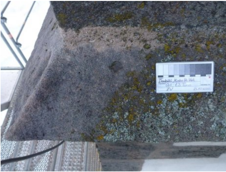
Turmgesims: Während der Reduzierung des biogenen Bewuchses, links der bereits gereinigte Bereich.