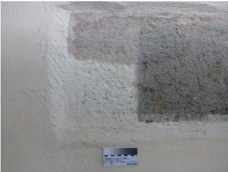
Während des Partikelstrahlverfahrens, der Fassadenanstrich auf der Steinoberfläche wird abgetragen.