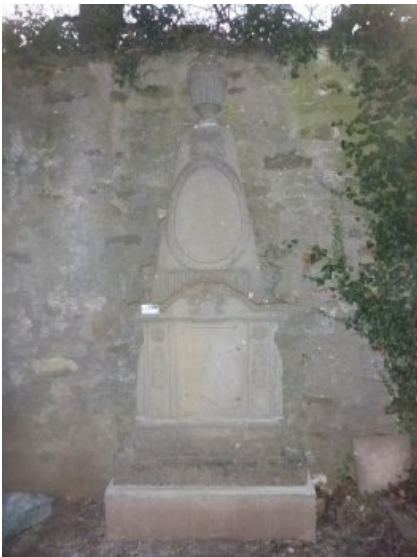
Das Epitaph nach dem Neuversatz am neuen Standort an der westlichen Friedhofsmauer.