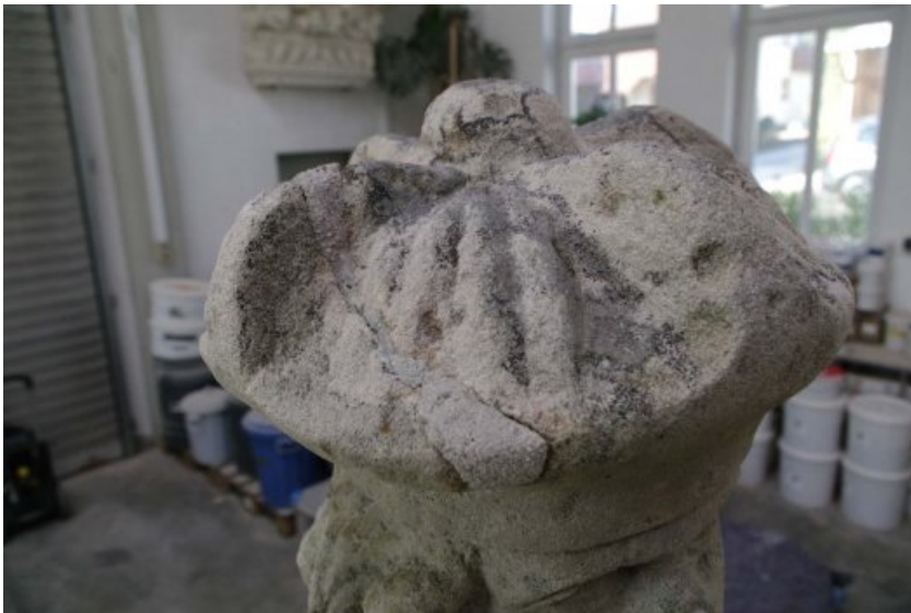
Zw.- Zustand: Detail Rissverlauf, partiell defekte Flanken wurden durch Rissinjektionsmassen verschlossen.