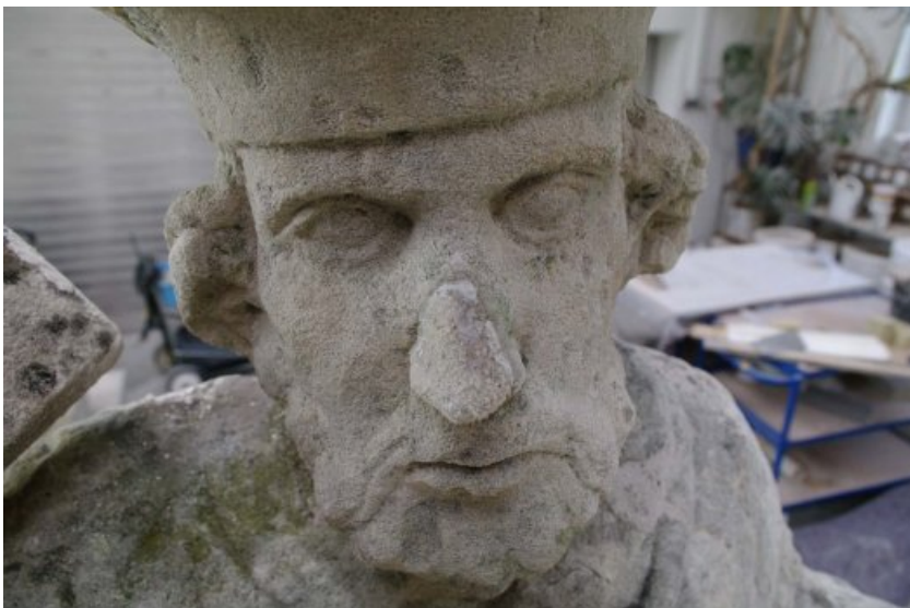
Zw.- Zustand: Detail Rissverlauf entlang der Nase, partiell defekte Flanken wurden durch Rissinjektionsmassen verschlossen.