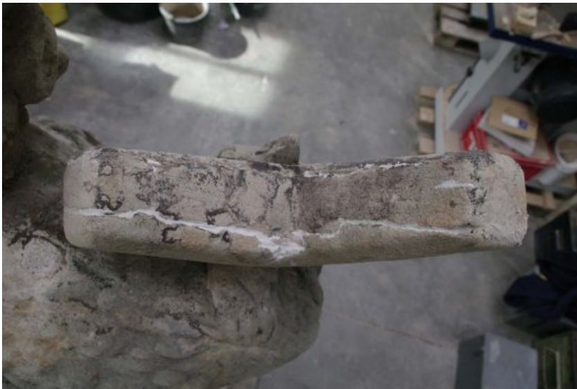
Zw.- Zustand: Detail von tieferen Rissen am Kreuz, Aufsicht. Risse wurden mit mineralischer Injektionsmasse verfüllt und oberflächlich mit Steinersatzmasse verschlossen