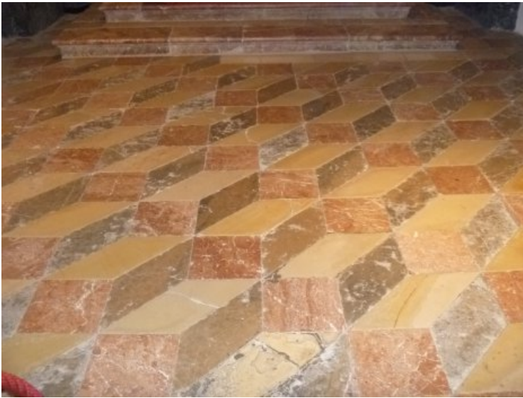
Vorzustand des Bodenbelags