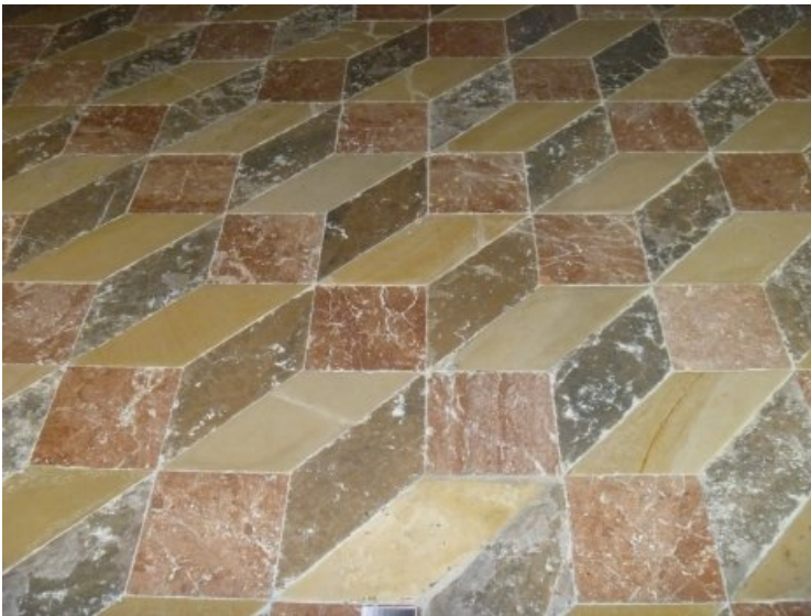
Nachzustand vom Bodenbelag