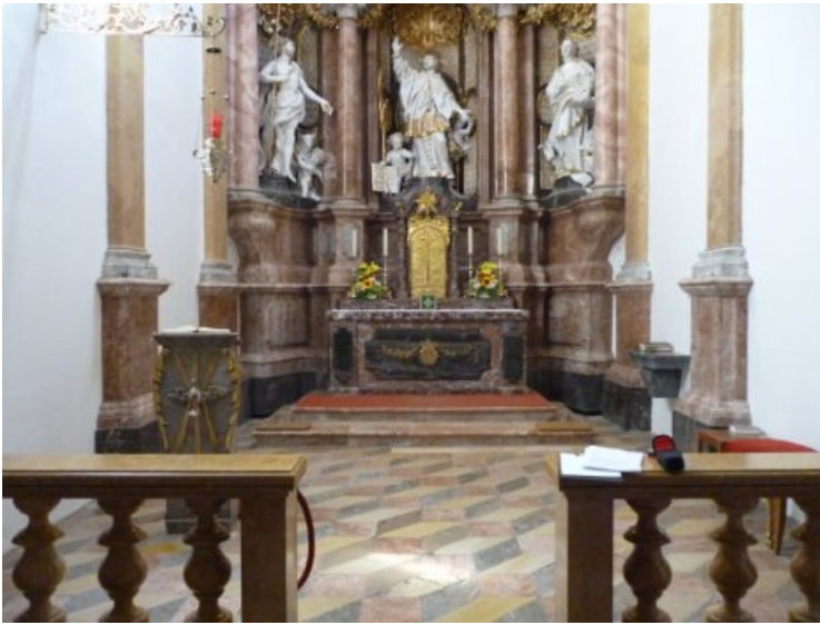
Ansicht der Johanneskapelle im Dom zu Freising