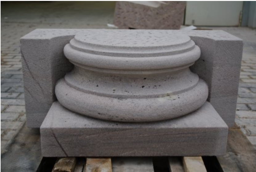
Halbsäulenbasis in Worzeldorfer Sandstein gefertigt, Gesellenstück