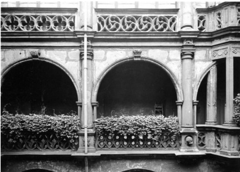
Aufnahme der Arkadengänge aus den 1930er Jahre