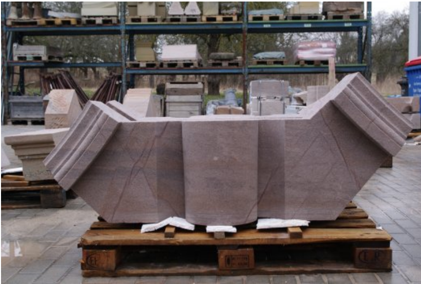
Kämpferstein in Worzeldorfer Sandstein gefertigt