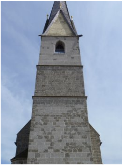
Der Turm der St. Vituskirche, Emersham