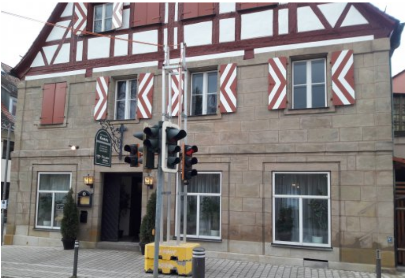
Das Gasthaus während der Restaurierung. Nach Einbau der Sockelplatten, die im Wasserbad salzreduziert worden waren, und Neuteile, Ergänzen von Fehlstellen an Werksteinen und Verfugen.