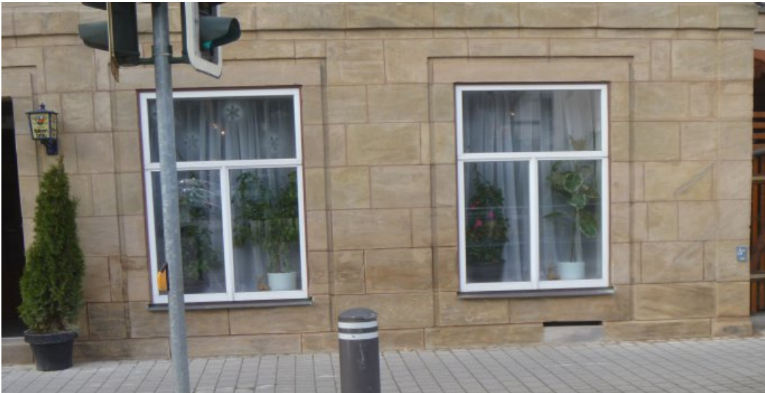
Der Sockelbereich der Straßenfassade nach der Bearbeitung. Die jüngeren Sockelplatten wurden retuschiert und der Fugenstrich rekonstruiert.