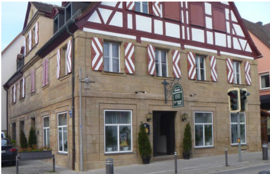
Das Gasthaus Zum Bären 2 in Heroldsberg nach der Restaurierung.