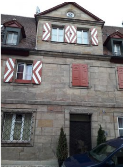
Die seitliche Fassade des Gasthauses in Heroldsberg nach der Restaurierung.