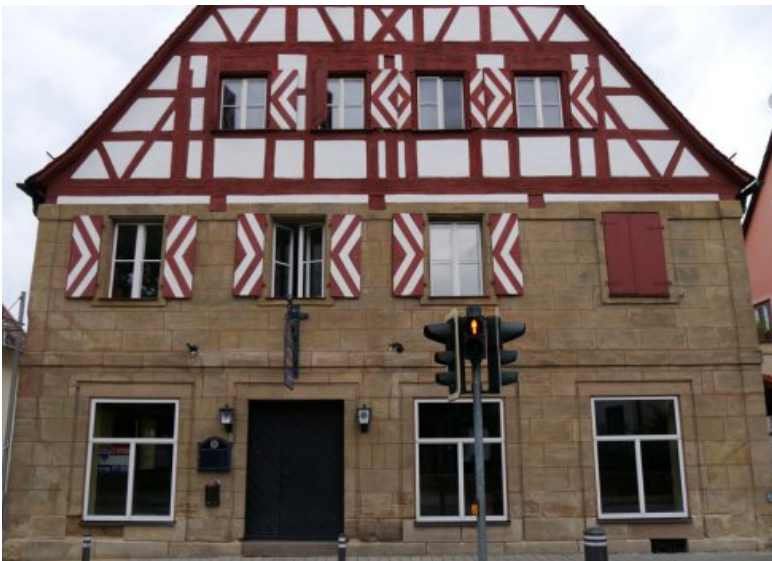
Die Fassade vor der Restaurierung. Insbesondere im Sockelbereich sind Schäden durch bauschädliche Salze zu verzeichnen.