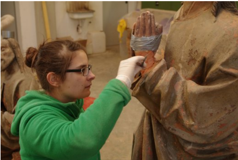
Arbeitsfoto zum Thema: Ergänzung von Terrakotta