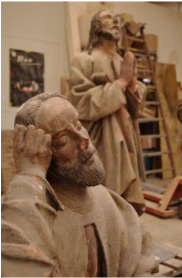
Figurengruppe während der Bearbeitung