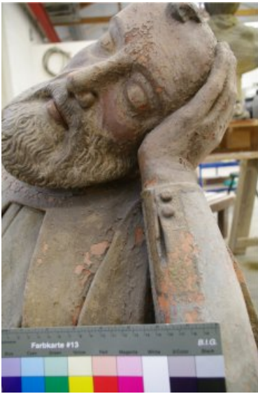
Figur des schlafenden Jüngers während der Restaurierung