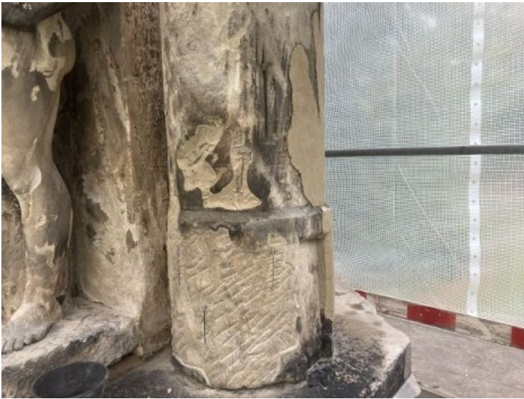
Beschädigtes Steingefüge und defekte Altergänzungen wurden zunächst mittels Steinmetzwerkzeug ausgearbeitet.