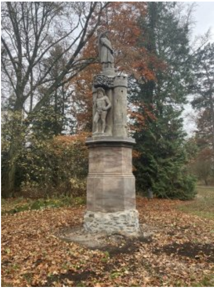
Die ehemalige Brunnen säule auf der Thomaswiese nach erfolgter Konservierung und Restaurierung.