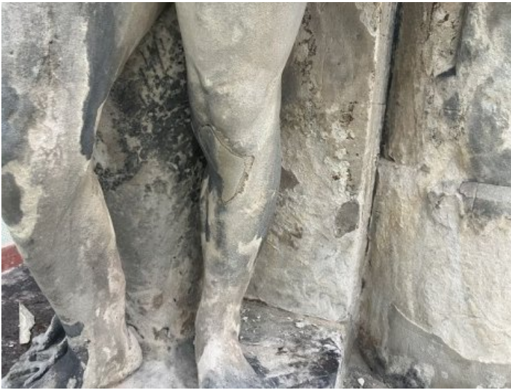
Nahaufnahme einer besonders beschädigten Stelle an der ehemaligen Brunnen säule.