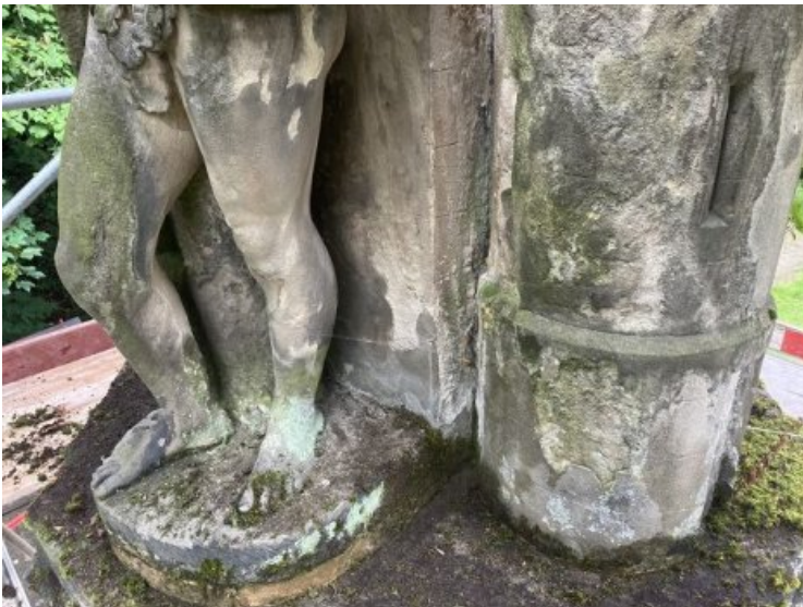
Der Grünbewuchs wurde zunächst manuell mittels Spatel, Schaufel u.Ä. entfernt.