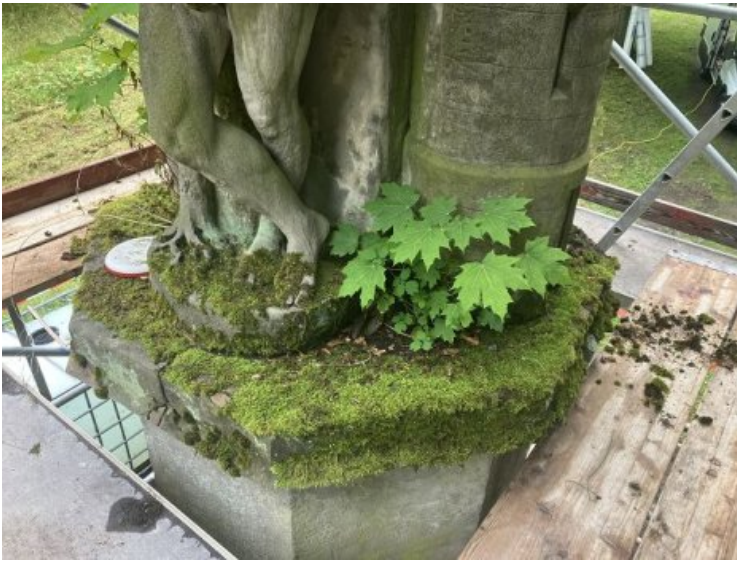
Aufnahme vor Beginn der Arbeiten - an einigen Stellen fanden sich Triebe von Grünpflanzen sowie biogener Bewuchs (u.a. Moose, Flechten).