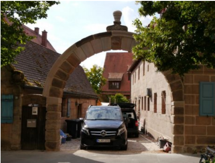
Endzustand des linken Torbogens