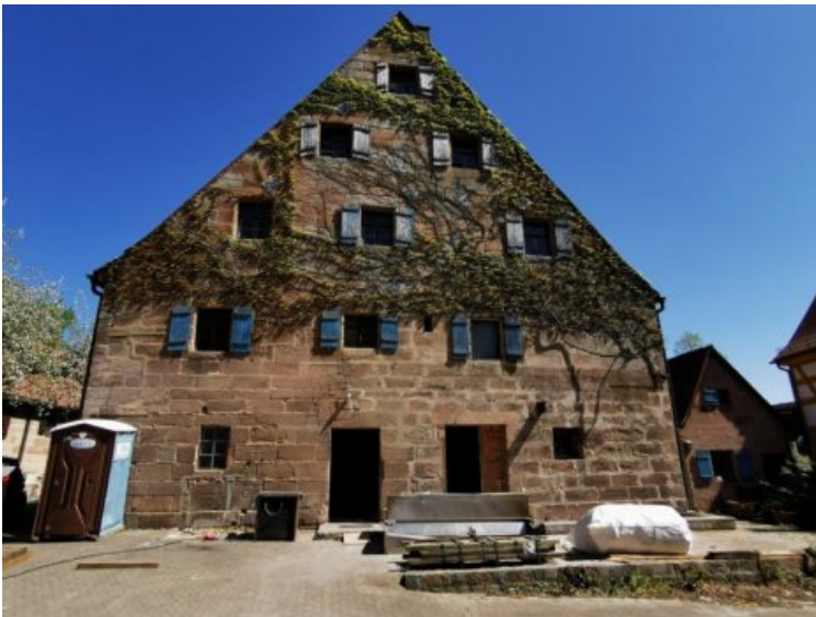
Vorzustand der Westfassade im Innenhof