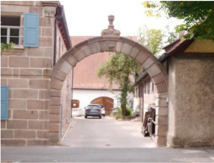
Endzustand des rechten Torbogens