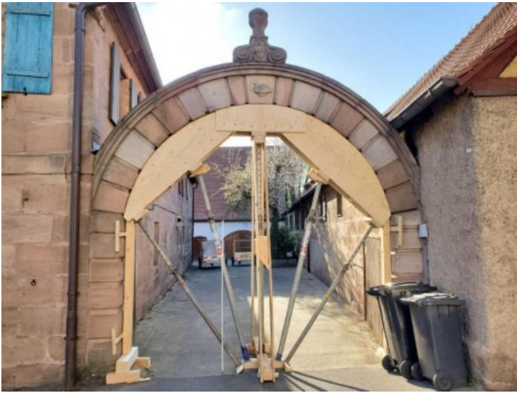
Zwischenzustand: Der beschädigte rechte Torbogen wurde mittels einer angepassten Bogenlehre neu errichtet.