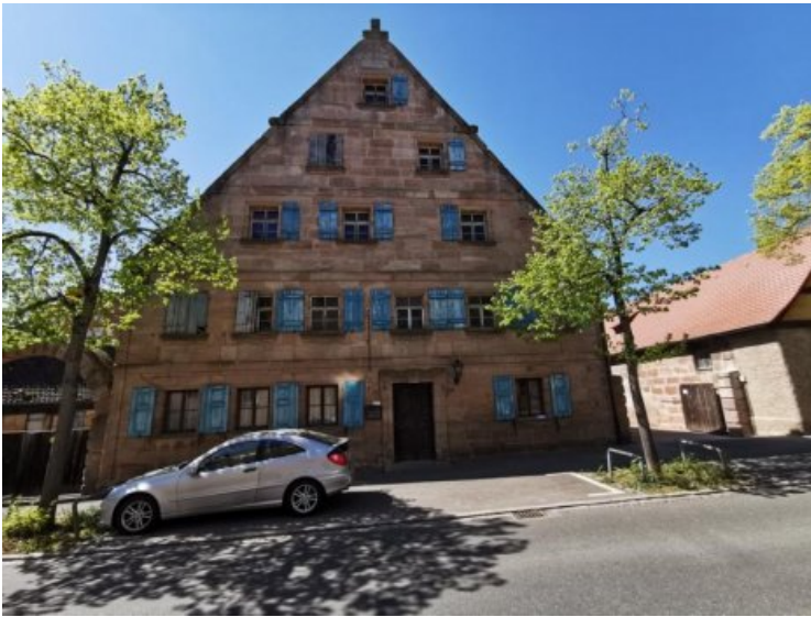
Vorzustand der Ostfassade