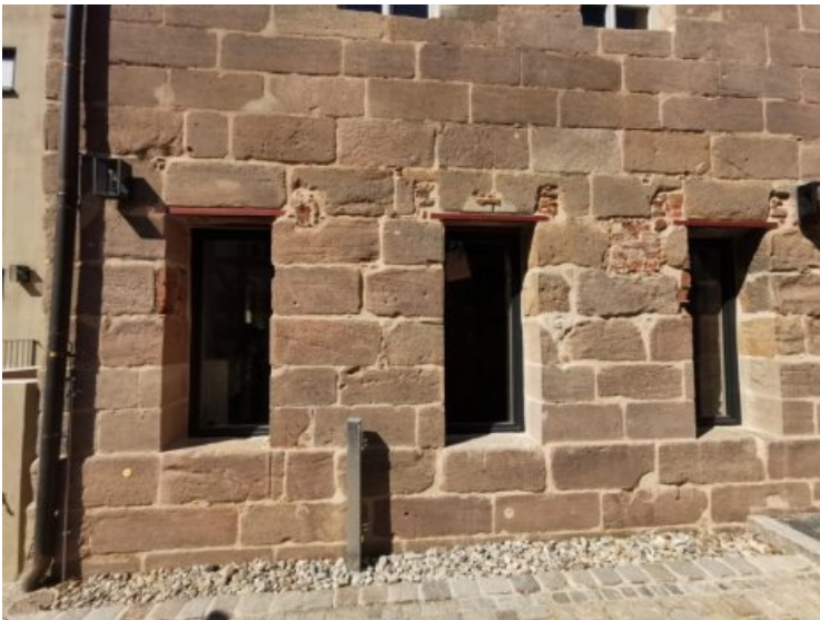
Endzustand: Südseite mit neuen, vergrößerten Fenstern