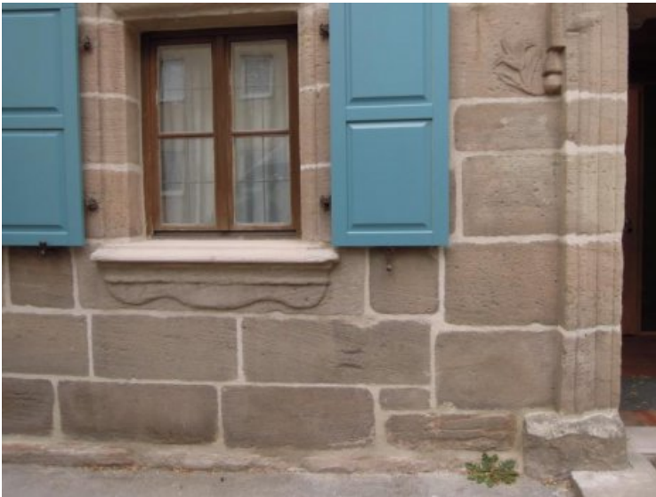
Endzustand: Detailansicht der straßenseitigen Fassade