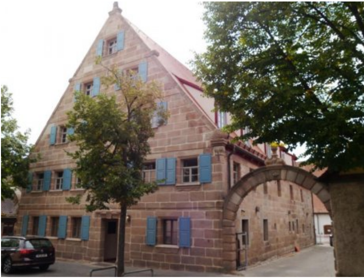
Gesamtansicht der Ostfassade mit rechtem Torbogen nach der Restaurierung