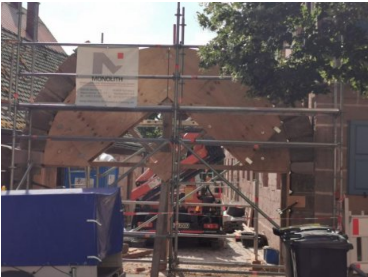
Zwischenzustand des größeren, linken Torbogens während der Wiederrichtung