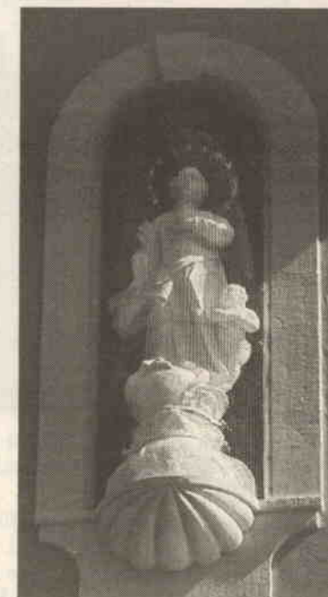
Die Madonnenstatue wurde von der Fa. Monolith restauriert.