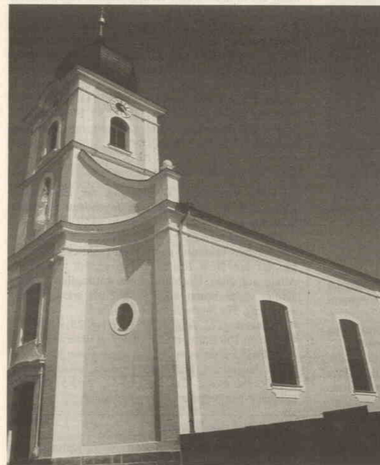
Auch eine neue Fassade erhielt St. Wolfgang in Kaltenbrunn.

Um Kosten zu sparen, hatten sich Gemeindeglieder dazu bereit erklärt, die Abbrucharbeiten für das Dach in Eigenregie zu übernehmen, natürlich in Absprache mit einer Fachfirma. Ebenfalls im neuen Glanz erstrahlt die Marienstatue, die in einer Nische des Turms untergebracht ist. Sie war stark beschädigt und musste von einer Fachfirma restauriert werden. Um die Figur vor Vogelkot zu schützen, wurde zudem ein Drahtnetz davor gespannt. Die veranschlagten Kosten belaufen sich auf rund 170000 Euro, aufgrund unvorhergesehener Maßnahmen dürfte der Rahmen jedoch überschritten werden.