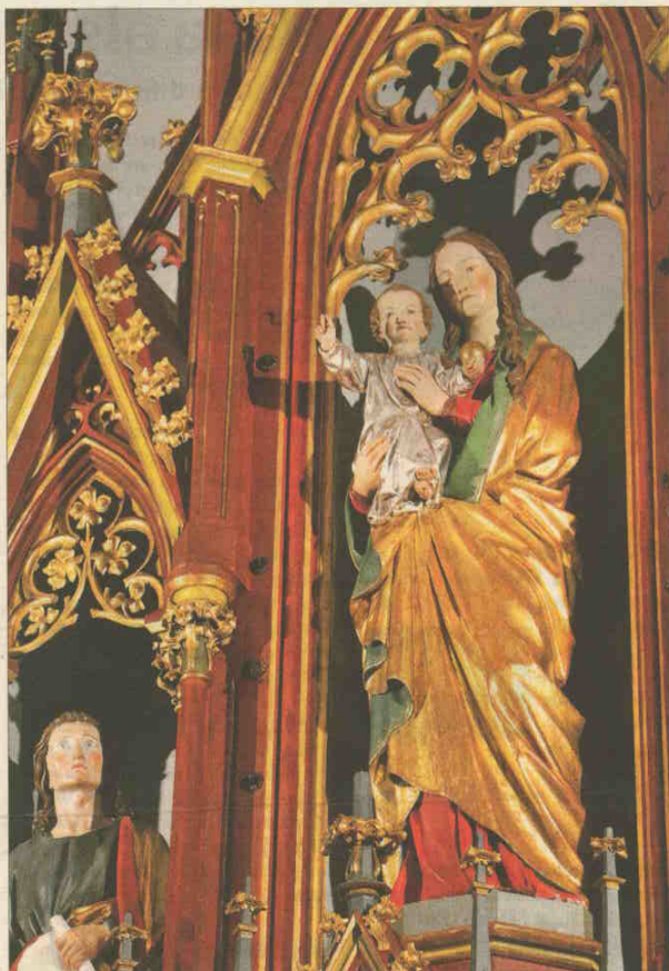
▲ Graf Ulrich von Oettingen wollte die St.-Sebastians-Kirche ursprünglich auch zu Ehren der Gottesmutter bauen. Daher hat Maria mit dem Jesuskind einen Platz am Hochaltar bekommen.

Verblüffend ist, dass der Hochaltar einer Sebastianskirche von einer Muttergottes-Figur mit Jesuskind dominiert wird. Weiß man jedoch, dass Graf Ulrich von Oettingen ursprünglich eine Kirche zu Ehren der