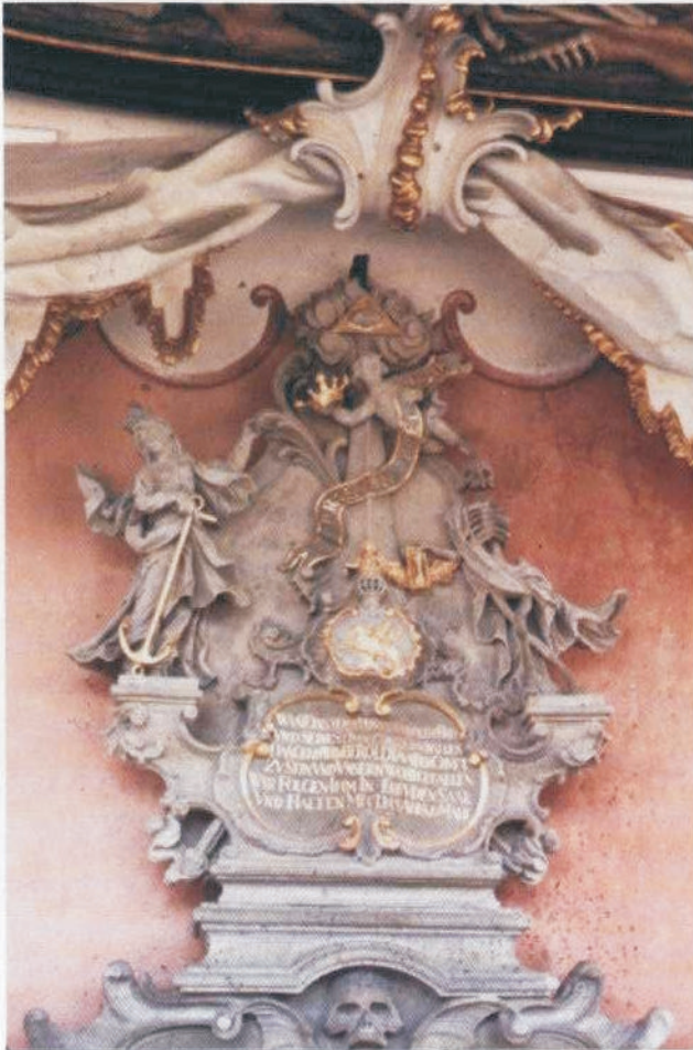
Zustand des Epitaphs nach der Renovierung 1975.

das Leben ein. Über der ganzen Szenerie ruht das von Strahlen- und Wolkenkranz umgebene Auge Gottes. Der Hintergrund mag ein wenig an eine fränkische Landschaft erinnern: Vor einer Hügelkette liegt ein mauer- und turmbewehrtes Städtchen.