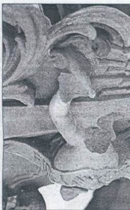
Krone weg, Kopf ab: Der Putto musste Körperteil und Attribut einem Souvenirjäger opfern.

Ein Werkstattbesuch: Epitaph des Heroldsgrabes wird derzeit in Bamberg restauriert — Mutwillige Zerstörungen müssen mühevoll ergänzt werden — Inschriftentafel verschollen