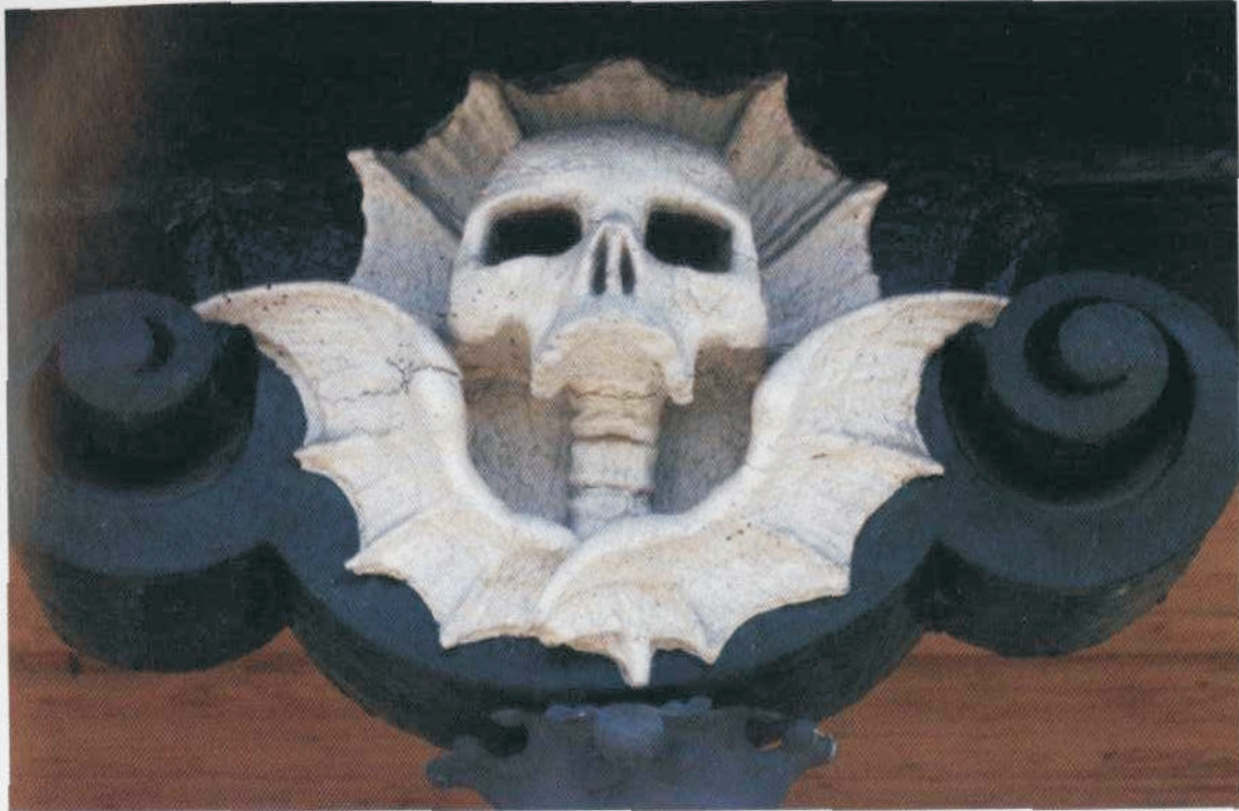
Hölzerner Totenschädel an der Grabstätte Herold.