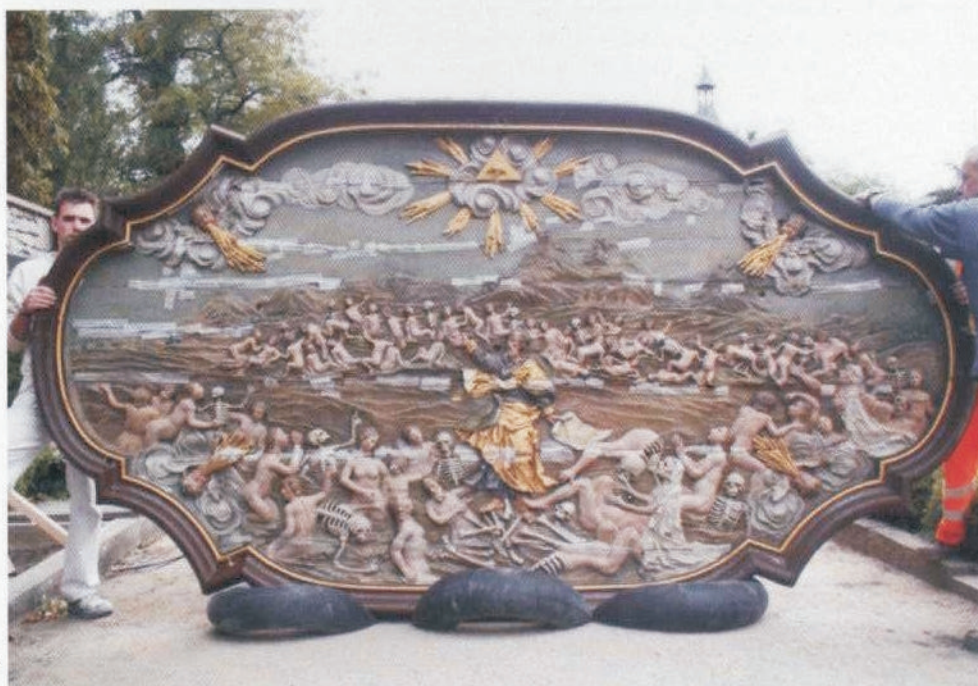
Deckenspiegel während des Abbaus im Frühjahr 2004.

So wurde bei der Restaurierung des Deckenreliefs diesmal dem natürlichen Schwundverhalten des Holzes Rechnung getragen, indem die unvermeidlichen Fugen nicht fest, son-