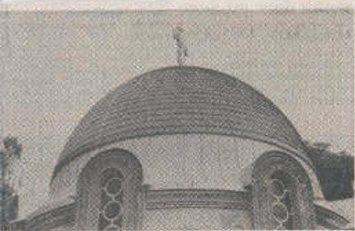
Von unten kaum zu sehen ist die elliptische Form der Kuppel, die den Gerüstbauern das Leben schwergemacht hat. Doch das ist vergessen.