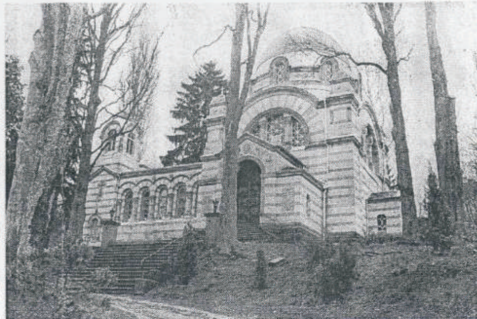
Besser zu sehen ist die russisch-orthodoxe Kirche an der Salinenstraße, seit einige der großen Bäume gefällt wurden. Und das Gotteshaus präsentiert sich mit neuer Fassade und neuem Dach.

Die Bruderschaft des Heiligen Fürsten Wladimir e.V. hat viel Eigenleistung eingebracht. Trotzdem bleiben noch Gesamtkosten von 600000 Mark, die nur zum Teil durch Zuschüsse gedeckt sind.