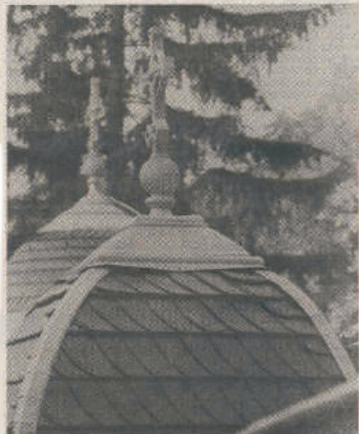
Den Kreuzen auf den Seitentürmen sieht man ihr Alter nicht mehr an. Sie wurden gründlich gereinigt und gestrichen.